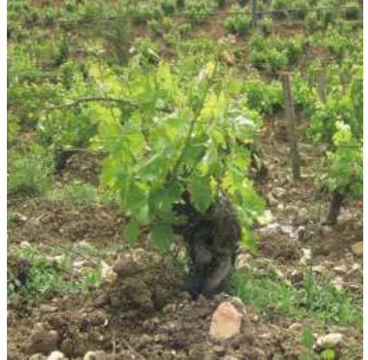
alter Weinstock in der Gallura

Die Gallura liegt im äußersten Nordosten Sardinien, diese Gegend ist vor allem touristisch bekannt durch die berühmte Costa Smeralda, einer Küstenlandschaft mit weißen Stränden, glasklarem in verschiedenen Blautönen schimmernden Buchten und vom Meer bizarr gestalteten Granitformationen. Hinter der Küste fahren wir durch die Weinberge und Korkeichenwälder der Gallura. Hier findet die Vermentino Rebe ideale Bedingungen. Die Böden bestehen aus Granitverwitterungen, sie sind wasserdurchlässig mit steinigem, fast felsigen Untergrund. Die Weinstöcke müssen sehr tief wurzeln, um sich mit Wasser und Nährstoffen zu versorgen. Eine wichtige Voraussetzung für konzentrierte Weißweine. Ein weiterer Grund für die Einzigartigkeit der Vermentino-Weine aus der Gallura ist das Klima. Das westlich gelegene Limbara-Massiv sorgt für kühle Nächte und damit zu recht hohen Temperaturunterschieden zwischen Tag und Nacht, was die Aromenbildung der Weine unterstützt. Auch die recht hohen Lagen 300 bis 450 m über dem Meeresspiegel tragen zur Qualität dieses Vermentino bei. Der S'èleme ist unter den Vermentino der Kellerei Monti der Leichteste und auch der Eleganteste. Ein Vermentino mit einem komplexen Bouquet: mineralische Noten, Zitrusfrüchte, aber auch dem Duft der sardischen Macchia wie Myrthe, Rosmarin, Zistrose und Ginster. Im Mund beeindruckt das Spiel vieler Aromen, der Abgang ist lang und endet in einem mandeligen, angenehmen leicht bitteren Finale.