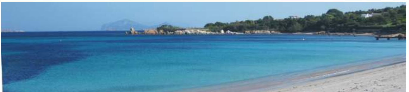
Weißer Strände, türkisblaues Meer, Wind und Sonne an der Costa Smeralda im Nordosten Sardinien.

In die Neujahrs-Enoteca gehört natürlich auch ein Rotwein - lesen Sie mehr über den Refosco →