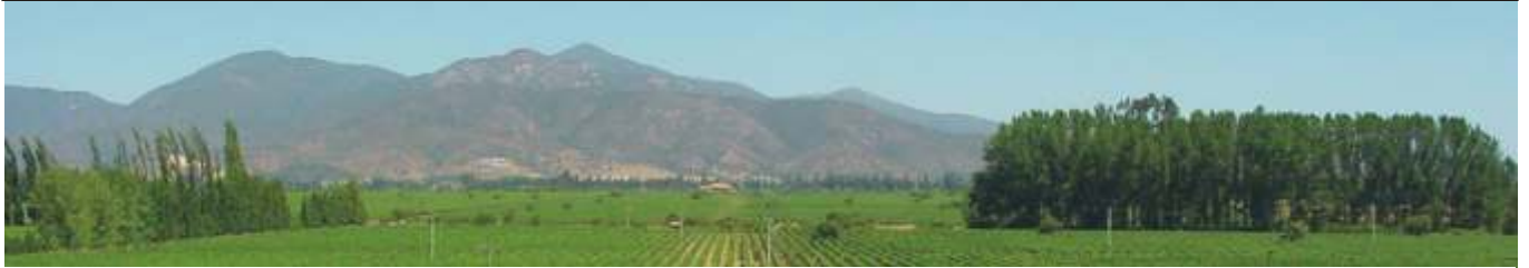
Umgeben von Bergen - Felder mit Reben im Casablanca Valley Chile