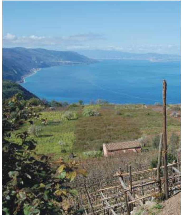
Entlang der zerklüfteten Steilküste ziehen sich die Weinberge im äußersten Süden Kalabriens.

Die Familie Criserà in Cantona, schon seit langem in der Landwirtschaft tätig, hat sich zunehmend auf den Wein konzentriert. Stetige Verbesserung in Qualität der alten Rebsorten durch sorgfältige Selektion der Klone, Investitionen in moderne Kellertechnik und gute Berater führen zu einem Ergebnis, dass sich sehr gut trinken lässt. Der Arghillà ist eine traditionelle Cuvée, Generationen haben Erfahrungen gesammelt, welche Sorten zusammen den besten Wein ergeben. Beim Arghillà sind dies: Gaglioppo, Alicante und Nerello Calabrese, die zusammen einen schön zu trinkenden Rotwein ergeben. Er duftet vor allem nach Sauerkirschen, begleitet von roten Johannisbeeren und einer Spur Eukalyptus. Fruchtig läuft er über die Zunge, keine störenden Gerbstoffe beeinträchtigen den Genuss. Eine gewisse Säure gibt dem Arghillà Struktur und Trunk und macht Lust auf den nächsten Schluck.